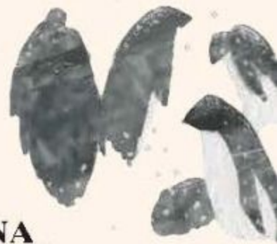
FURTUNA DE ZĂPADĂ