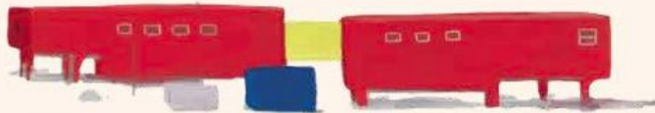
CASA NOASTRĂ ÎN GHEAȚĂ